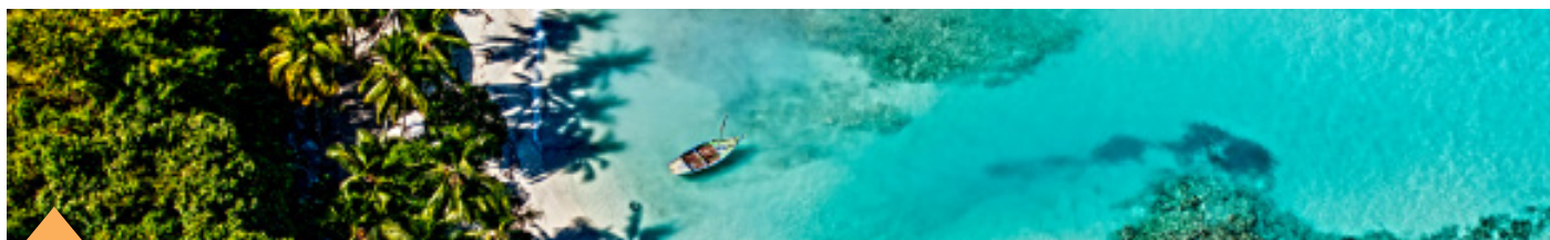
Vue aérienne de la plage rurale en Haïti

Ces deux nouveaux projets seront lancés en 2016.