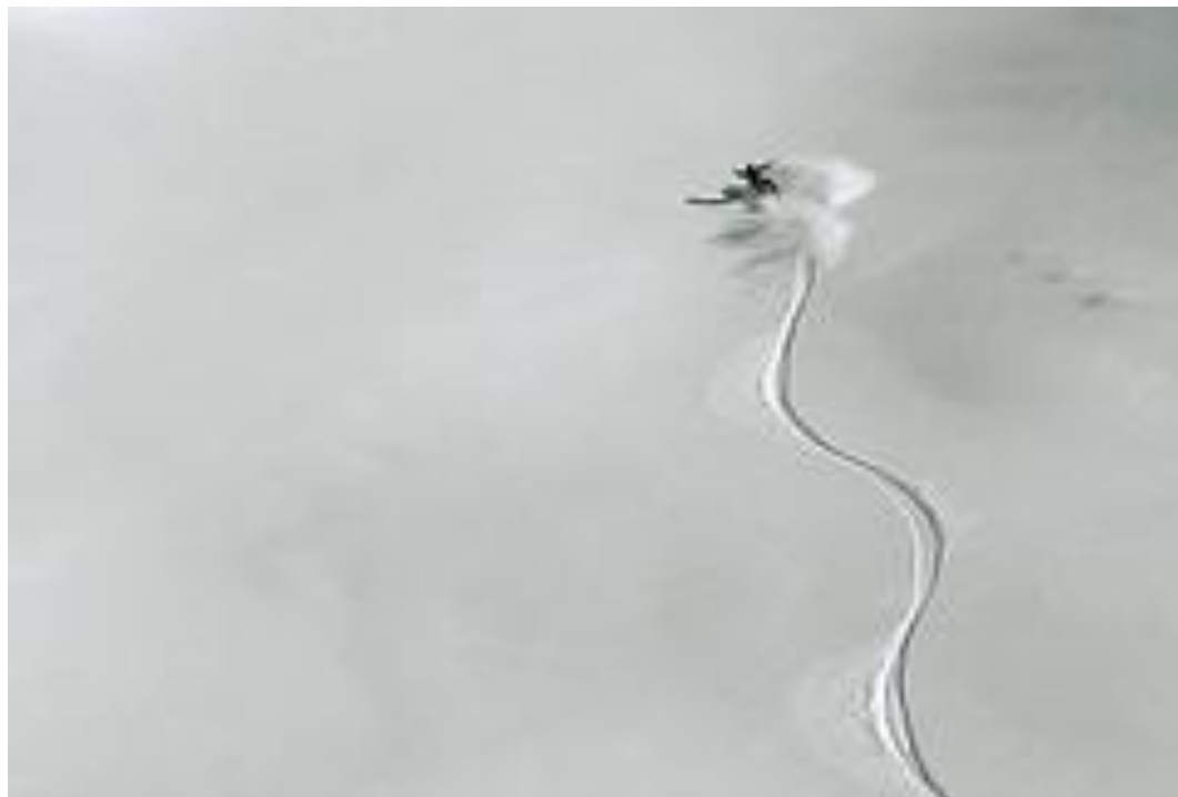
Galerie Benoît DANDONNEAU