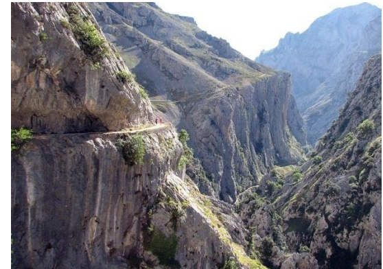
Ruta del Cares, Picos de Europa