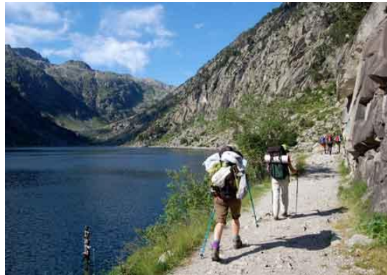
Valle de Boi, Pirineo Catalán