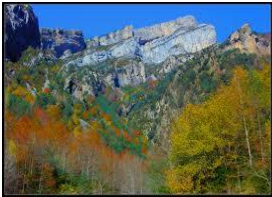
Canón de Añisclo, Pirineo de Huesca