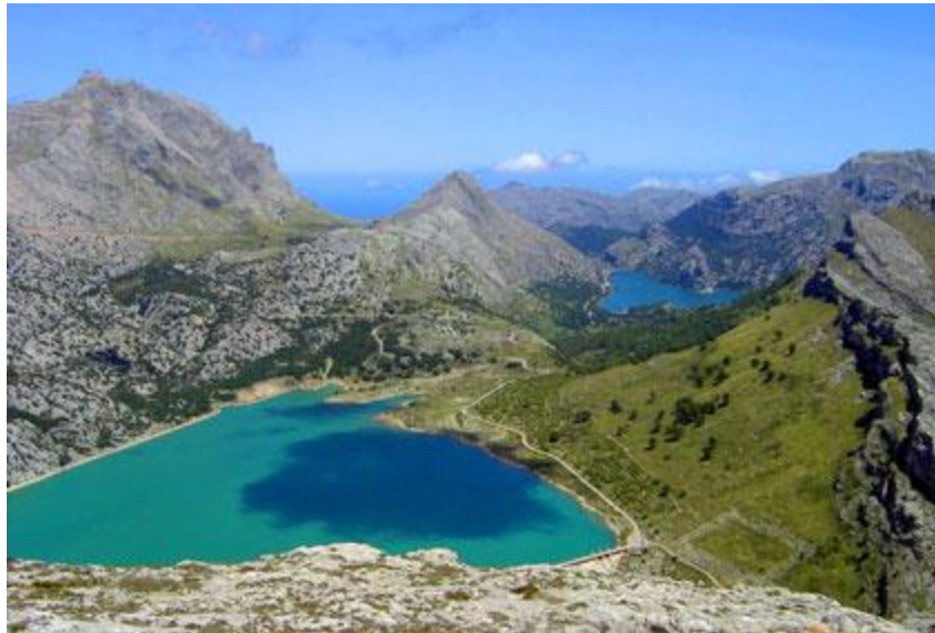
Sierra de Tramuntana, patrimonio mundial de la UNESCO

Recursos de turismo de montaña por todo el país, incluidos los archipiélagos: Pirineos, Montes Vascos, Picos de Europa, Sierra de Guadarrama, Sierra Nevada, La Palma, Sierra de Tramuntana (Mallorca).